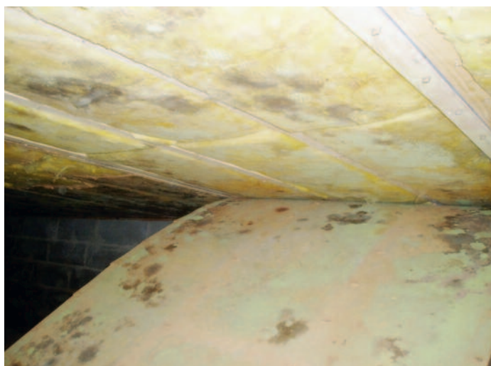
Fuktskador i uteluftventilerad krypgrund.

Samtliga artikelförfattare är styrelsemedlemmar i Byggdoktorerna i Sverige.