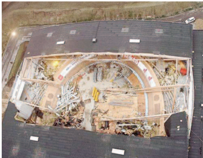
Skadefall 2: Den kollapsade cykelvelodromen i danska Ballerup.

Ovanstående exempel visar vikten av att använda den fuktmekaniska kunskap som finns att tillgå. Återföring och implementering, i hela byggbranschen, av kunskap som erhålls i samband med fuktskadeutredningar torde minska upp-