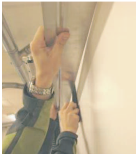
Skadefall 1: Buktande gipsvägg.

Skadefall 2. En medialt omskriven fuktskada är cykelvelodromen i Ballerup i Dan-