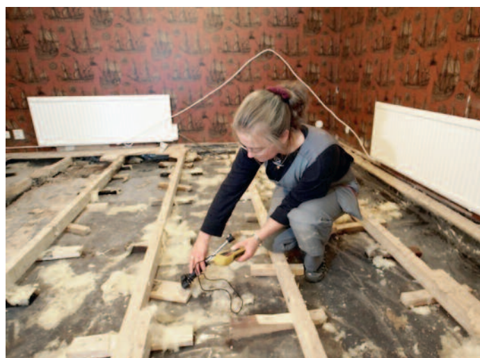
Fuktskada, platta på mark med uppreglat trägolv.