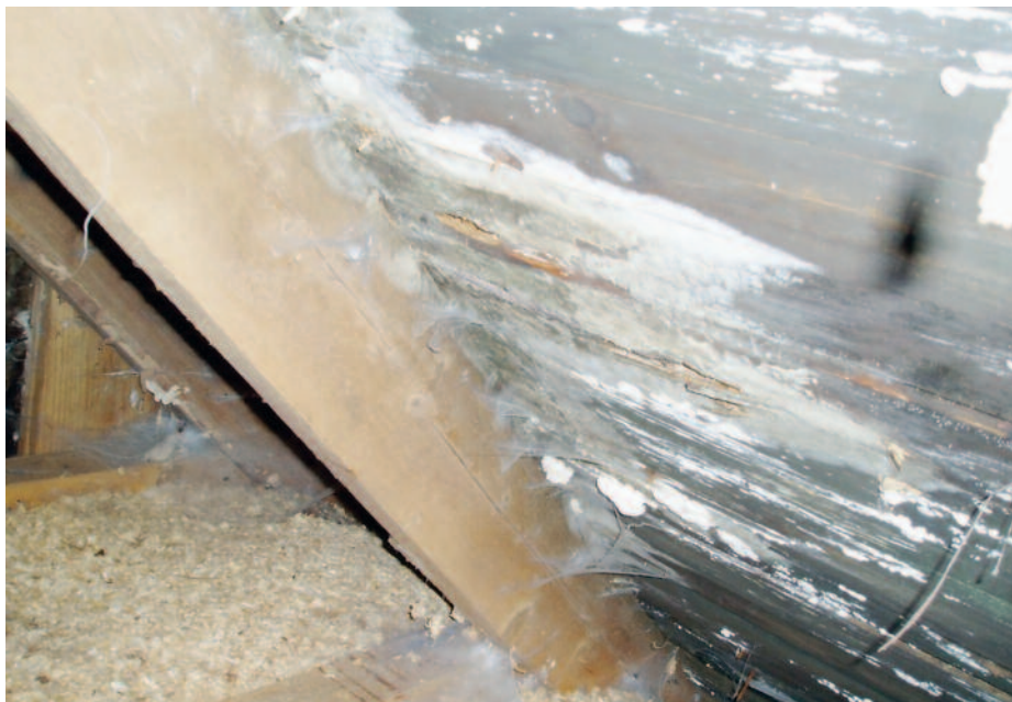
Fuktskada, uteluftventilerad vind.

Den vanligaste typen av fuktskada under 1980-talet var ofta kopplad till grundläggningen. Vanligt förekommande problem var betongplattor på mark med olika typer av överliggande värmeisolering, till exempel det uppreglade golvet, invändigt isolerade källarytterväggar, till exempel EW-grunder, uteluftventilerade kryp-